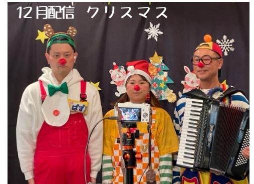
12月配信 クリスマス

ほんポートの司書さんが、施設や本の紹介をしてくれました!子どもたちのリクエストした本も、たくさんある中から一生懸命探してくれました。がんセンターには絵本の貸出しもしました。