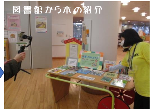
図書館から本の紹介

ほんポートの司書さんが、施設や本の紹介をしてくれました!子どもたちのリクエストした本も、たくさんある中から一生懸命探してくれました。がんセンターには絵本の貸出しもしました。