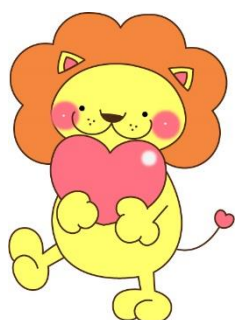
イラスト エイキミナコ 絵本作家 小児がん経験者